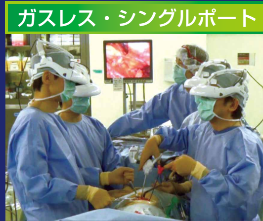
3Dヘッドマウント ディスプレイ内の 4画面同期映像